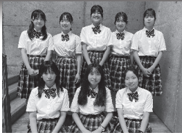
山陽女学園中等部・高等部（実行リーダー）